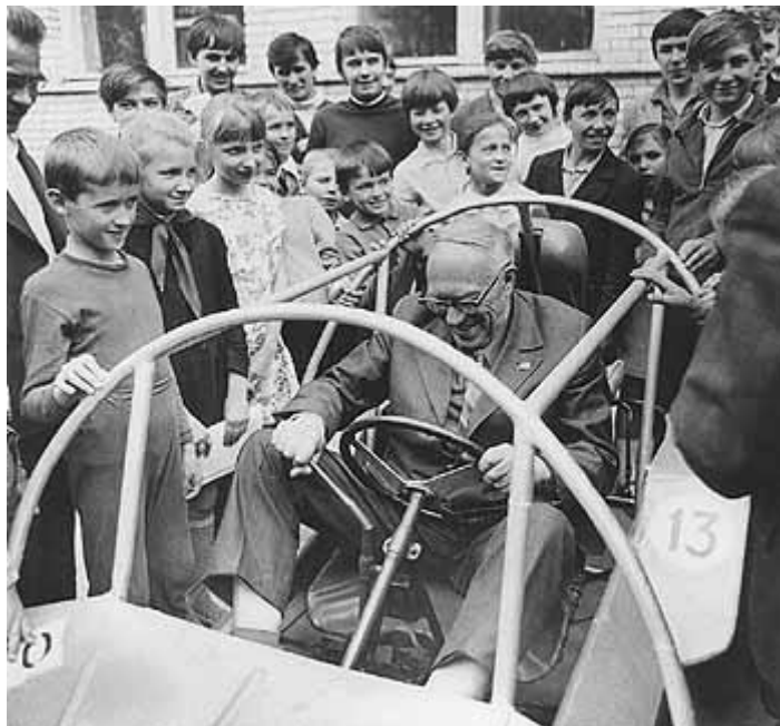
"Приемка" машины, сделанной в Клубе юных техников