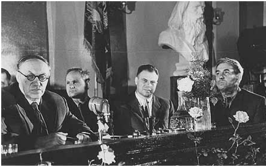
На первом Общем собрании Сибирского отделения АН СССР (в помещении Западно-Сибирского филиала АН СССР). В Президиуме М.А.Лаврентьев, С.А.Христианович, А.А.Трофимук, Т.Ф.Горбачев. Май 1958 г.