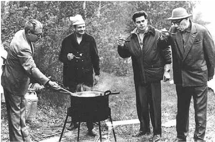
Сибирская уха. Гости Академгородка: летчики-космонавты СССР К.П.Феоктистов и Г.Т.Береговой, между ними летчик-космонавт США Нил Армстронг. 1970 г.