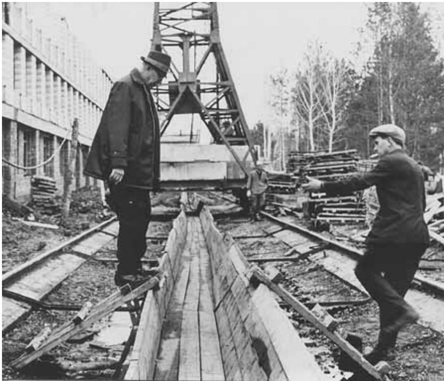
Перешагнуть или перепрыгнуть? На строительстве НГУ. 1959 г.