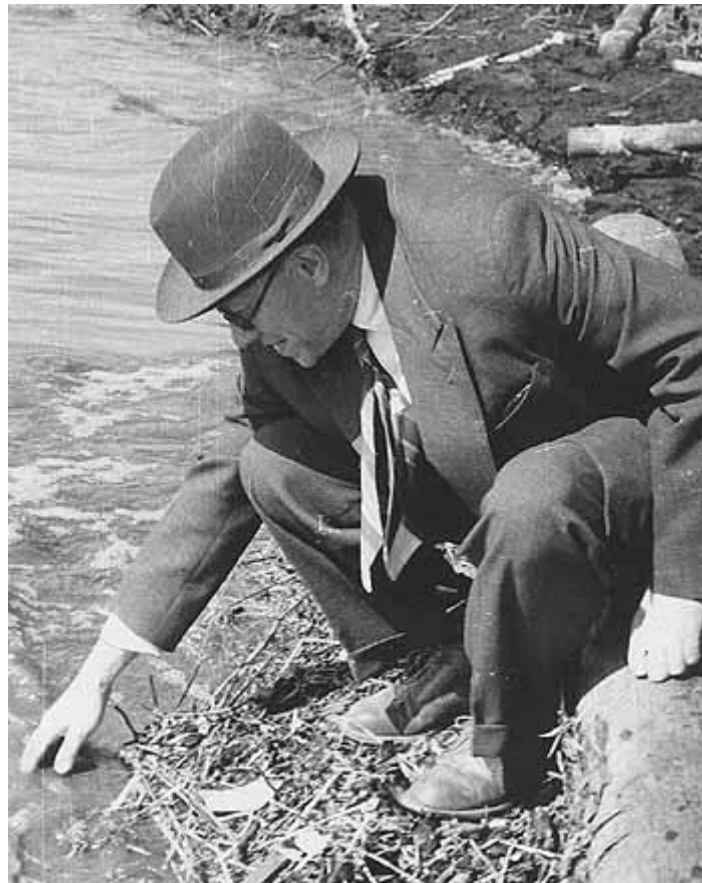
Обское море еще только наполняется. Может, искупаться? 1958 г.