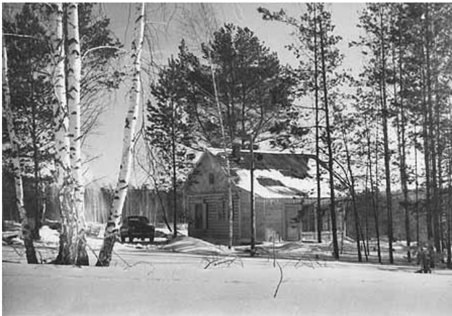
Домик академика Лаврентьева. 1958 г.