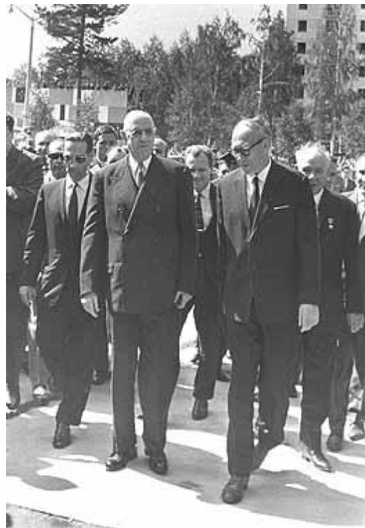
Визит в Академгородок Президента Франции Шарля де Голля. 1966 г.