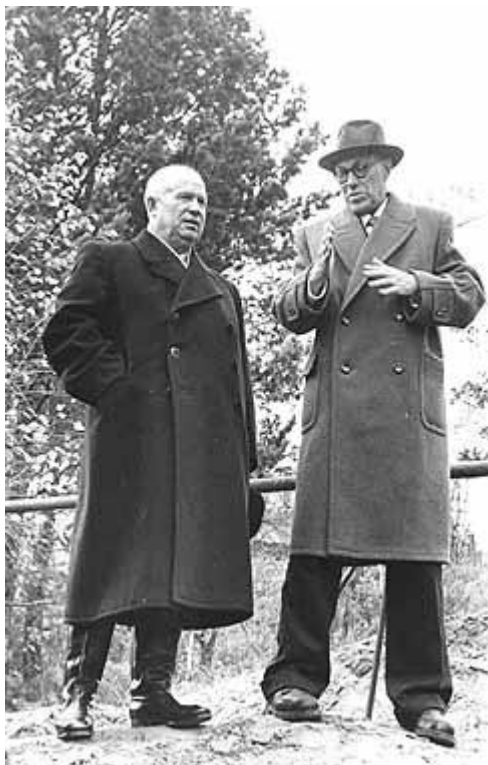
С "крестным отцом" Сибирского отделения, первым секретарем ЦК КПСС и председателем Совета Министров СССР Н.С.Хрущевым в строящемся Академгородке. Октябрь 1959 г.