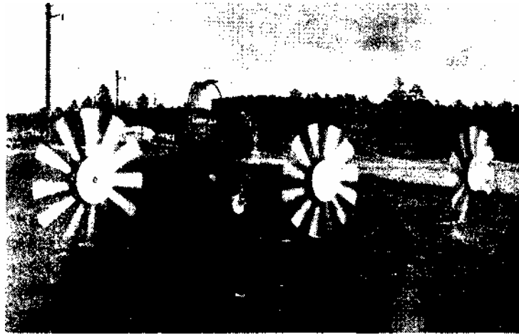
Фото 3. Трехмодульный обратноосмотический опреснительный ветро-агрегат